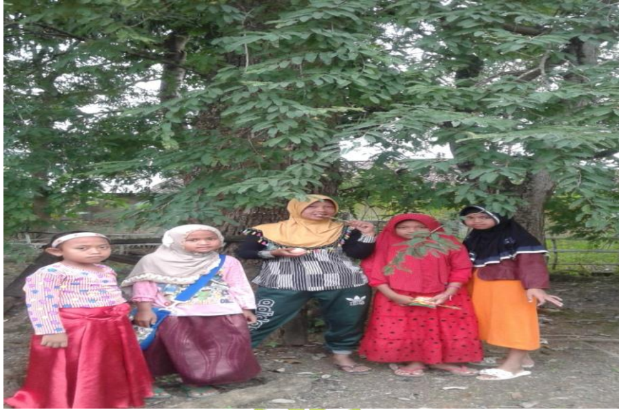
Mengambil Makanan Sesajen