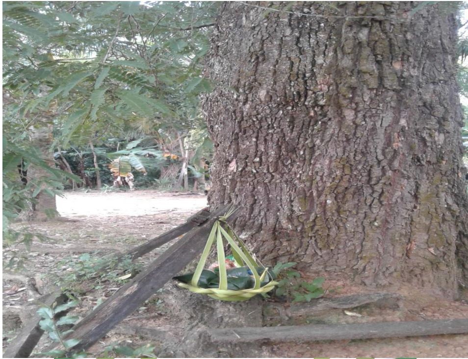
Sajen ditaruh di bawah pohon