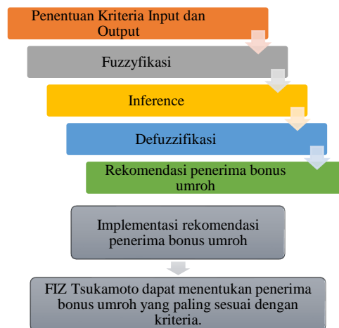
Gambar 2 Algoritma FIS Metode Tsukamoto Penentuan Penerima Bonus

penerimaan bonus umroh, dibentuk fuzzyfikasi , setelah inference dengan cara membuat rules dan langkah terakhir hitung defuzzifikasi dari setiap variabel input.